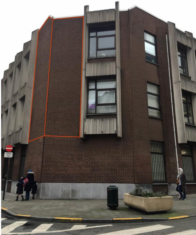
Localisation de la fresque, sis à l'angle rue du Canon et rue aux Choux, 1000 Bruxelles