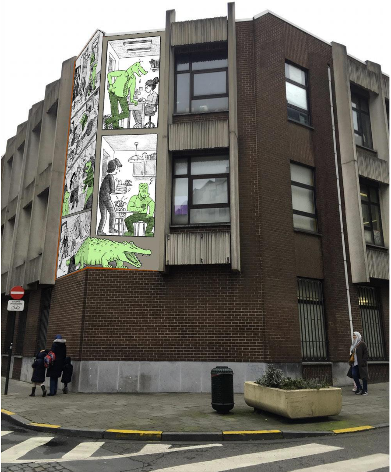
Visuel de la fresque « Crocodiles »